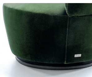
Finiture // Finishings